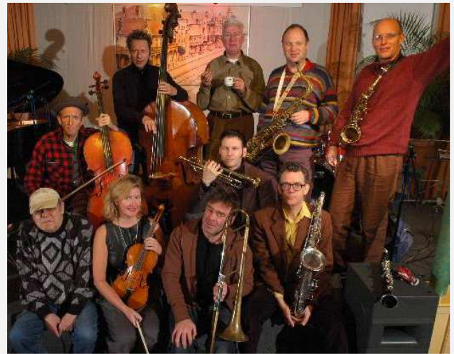
Het ICP Orkest