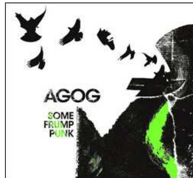
AGOG Some Frump Punk TryTone